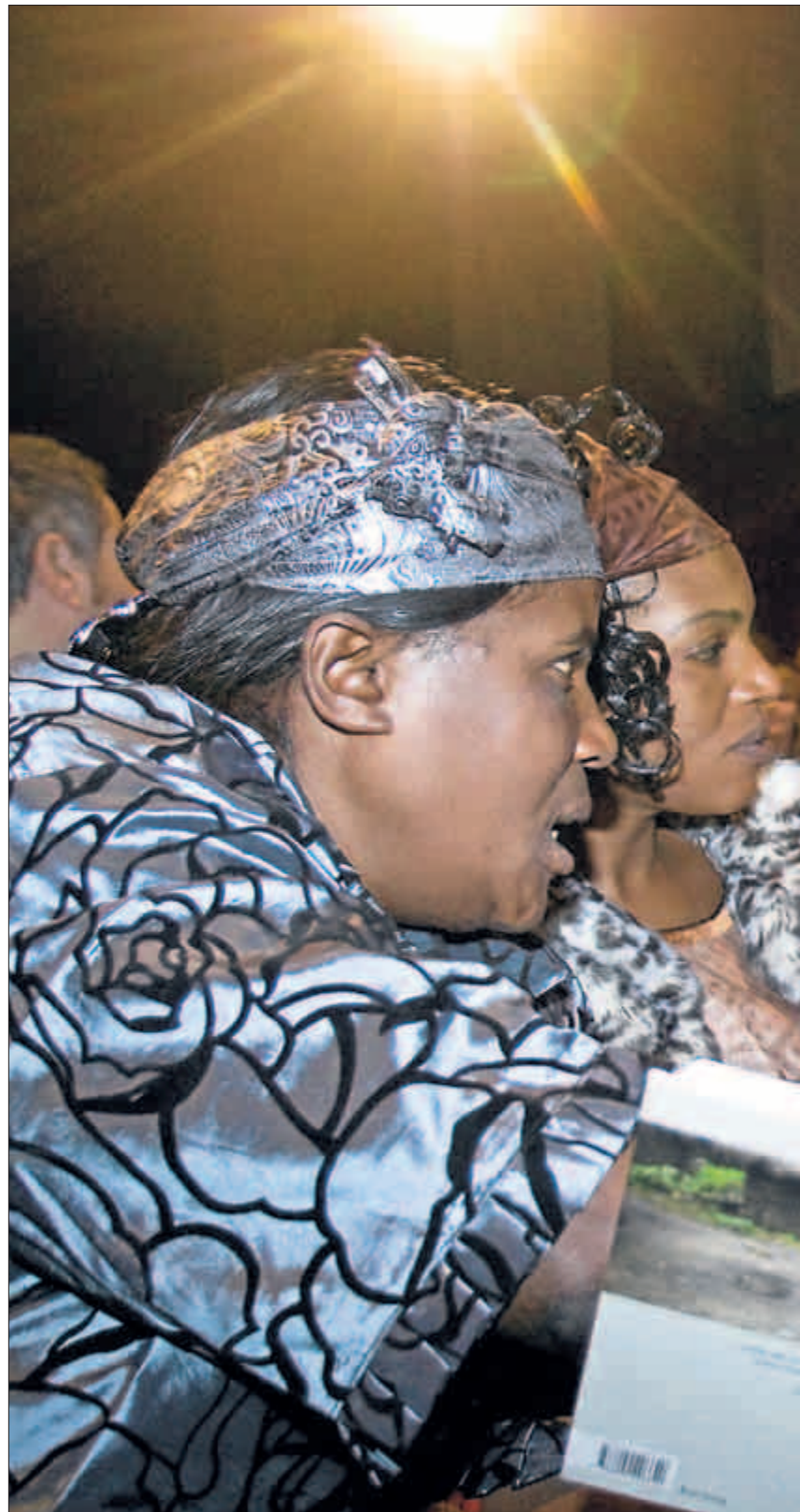
MED PÅ LANSERING: Utenriksminister Jonas Gahr Støre var en av innledderne under lanseringen